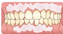
3. フェノール剤の塗布