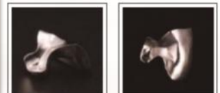
金銀パラジウム合金