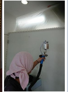
院内コーティングの様子